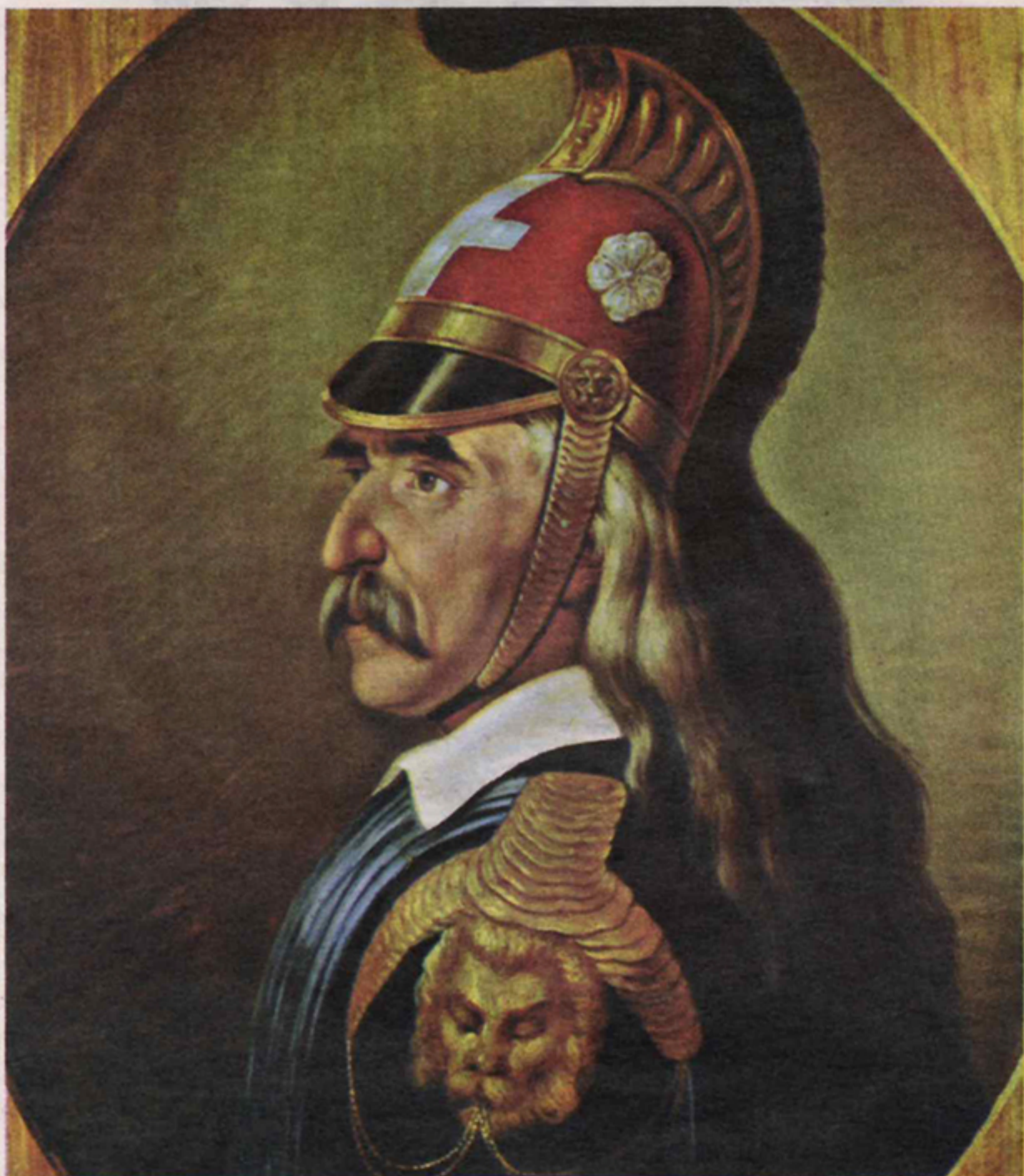
Ο Θ. Κολοκοτρώνης σε πίνακα του Θ. Τσόκου. Οι διαφορές με εικονιστική του απόδοση από τον Β. Mary είναι εμφανείς

Τα βιογραφικά σημειώματα επομένως του τόμου, τα οποία έχουν τη σπάνια δυνατότητα να συνοδεύονται και από τη σχεδιαστική απεικόνιση του προσώπου, συγκροτούν ένα νέο σώμα πληροφοριών, των ανδρών που κυριαρχούν στα πολιτικά πράγματα των μετεπεναστατικών χρόνων (οι φιγούρες των γυναικών της εποχής που είχε αποδώσει επίσης ο ίδιος ζωγράφος είχαν ενταχθεί σε παλαιότερη έκδοση που είχε επιμεληθεί η Χ. Δημακοπούλου, Benjamin Mary, «Ελληνισμού απαρχές - ελληνικές προσωπογραφίες», Αθήνα 1992).