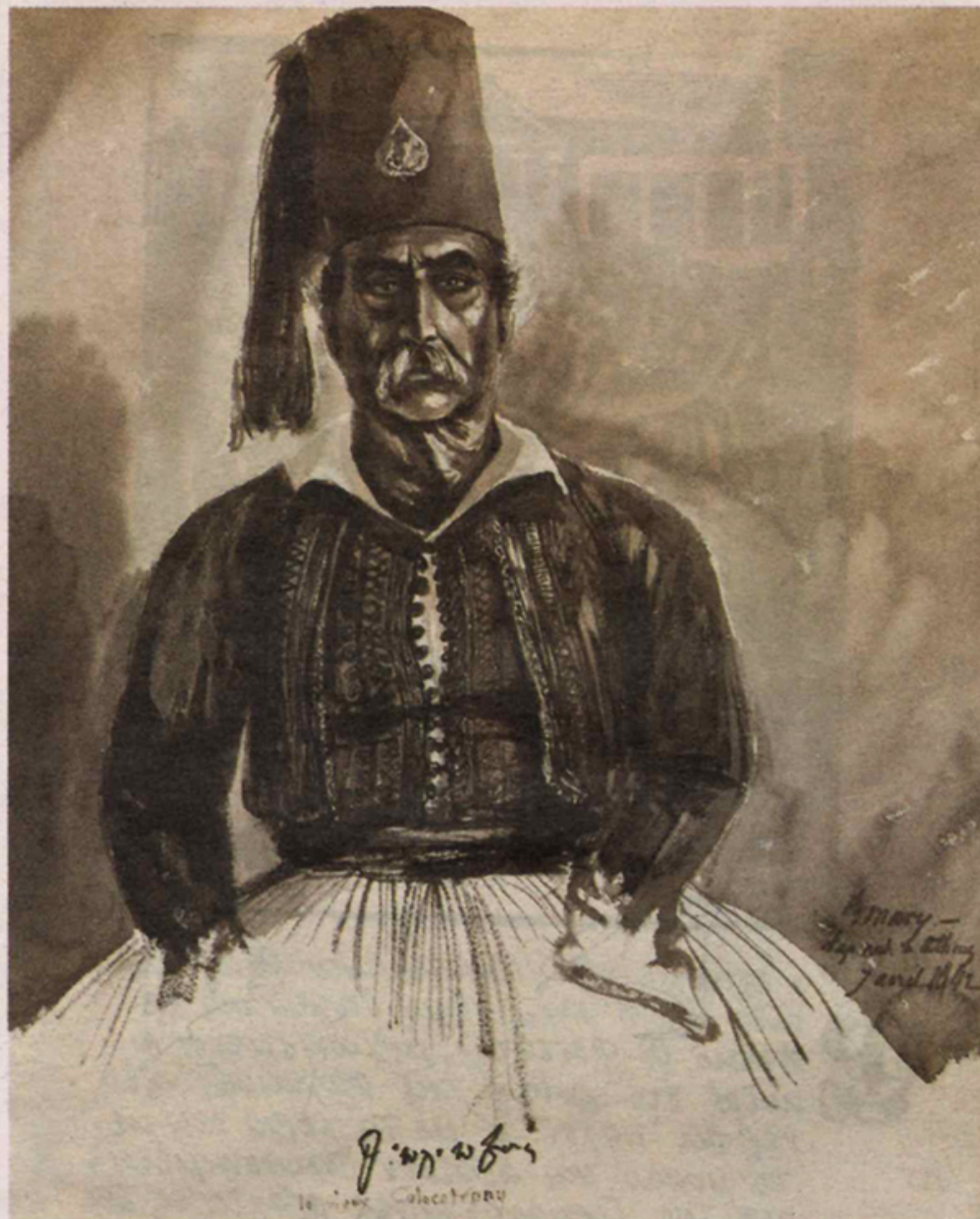
Η προσωπογραφία του Θ. Κολοκοτρώνη από τον Β. Mary

Η ελληνική παράδοση, σε αντίθεση με άλλες ευρωπαϊκές χώρες, είναι φτωχή. Ούτε αντίστοιχη σε μέγεθος και ποιότητα παραγωγή ζωγραφικών απεικονίσεων απαντά στη νεοελληνική τέχνη ούτε και χώροι ανάλογοι των μεγάλων National Portrait Galleries του αγγλοσαξονικού χώρου υπάρχουν στην Ελλάδα. Πολ-