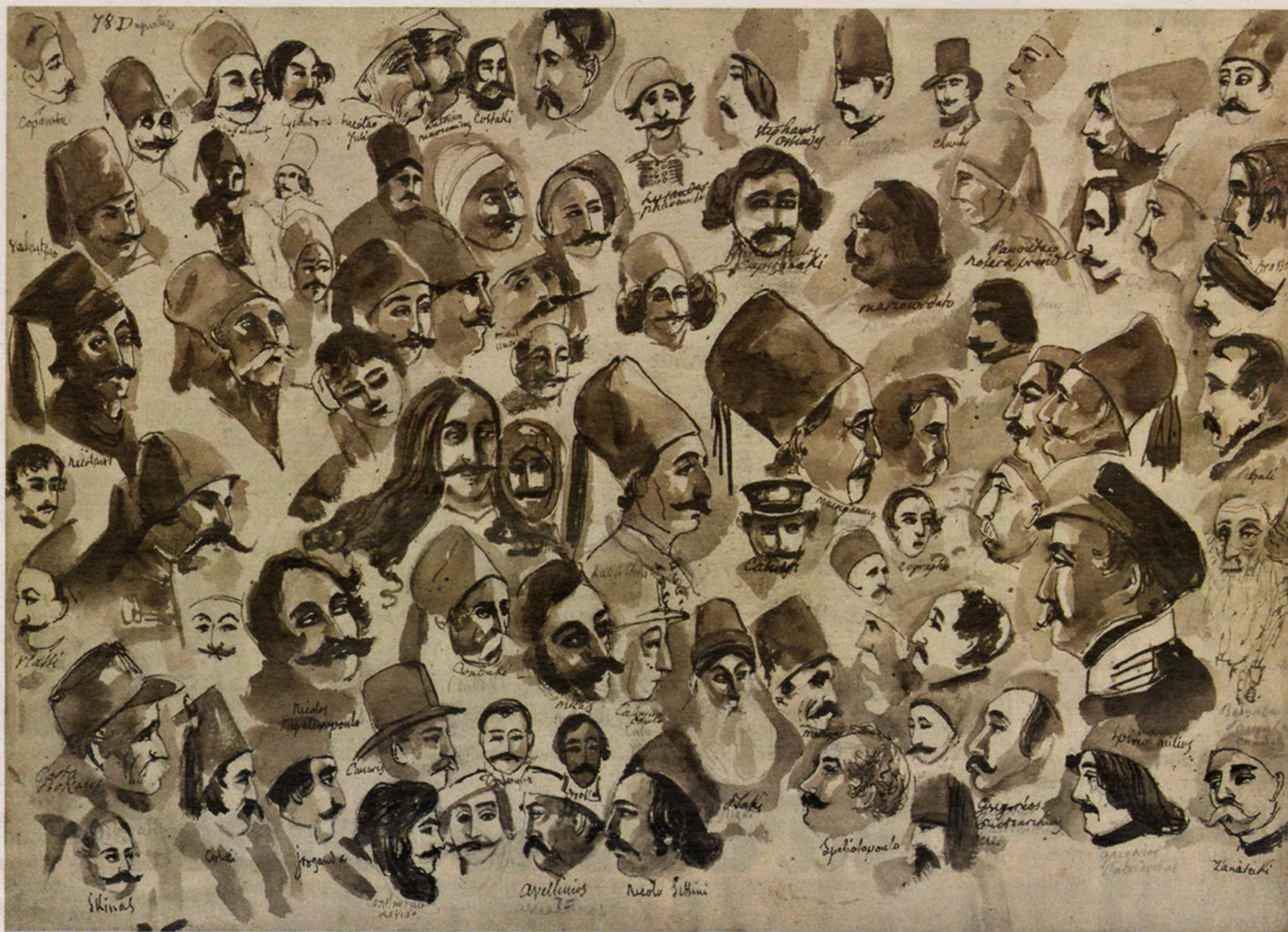
Πληρεξούσιοι και θεατές στην Εθνοσυνέλευση του 1843 όπως τους είδε και τους σχεδίασε ο B. Mary

Οι προσωπογραφίες ιερών και μοναχών που αποπνέουν επιβολή και μεγαλοπρέπεια, οι αναπάντεχες αποδόσεις γνωστών αγωνιστών, η αποκάλυψη της όψης λιγότερο διάσημων πολιτικών και αγωνιστών, η προσθήκη προσώπων της τότε κυπριακής κοινωνίας, οι εκφραστικές μορφές ανώνυμων ανδρών, με μόνο προσδιοριστικό στοιχείο τον τόπο κατοικίας τους, όλα αυτά συνιστούν, νομίζω, ανεκτίμητη συνεισφορά στη νεοελληνική προσωπογραφία.